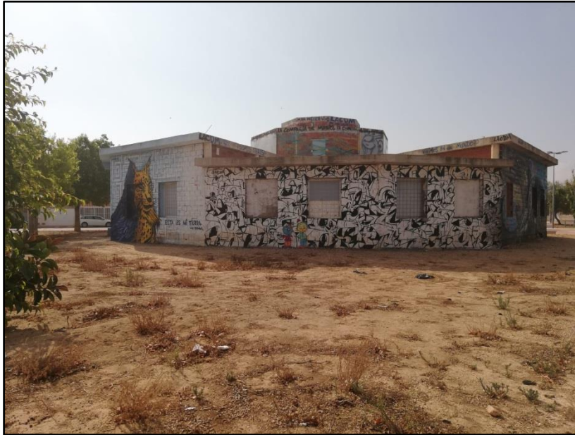
Imagen 14: Centro Cívico La Dorada