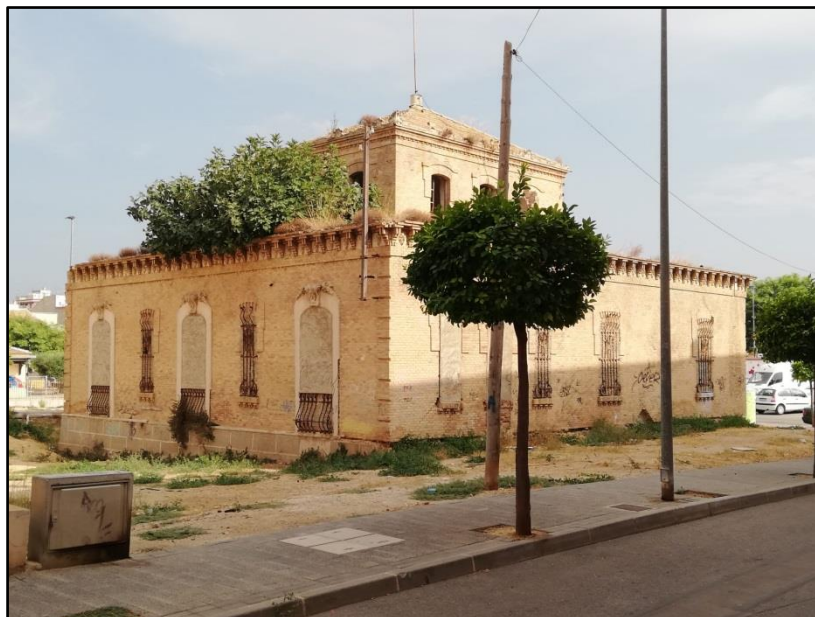
Imagen 2: Chalet Precioso