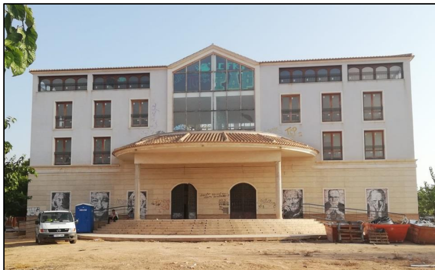
Imagen 16: Casa de la Juventud y Teatro-Centro Cultural Alcazareño