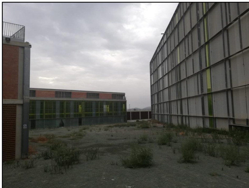
Imagen 7: Teatro Auditorio