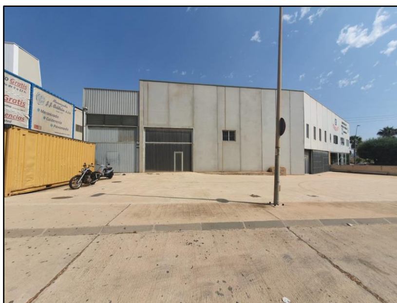
Imagen 8: Nave industrial arrendada