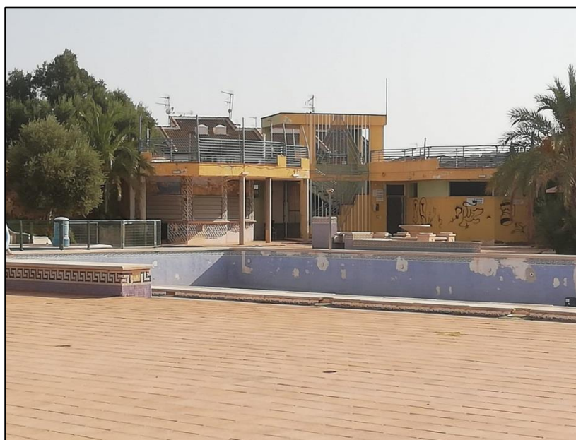
Imagen 6: Piscina Municipal Ola Azul