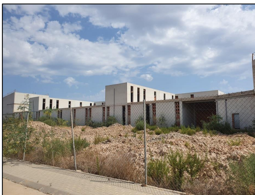
Imagen 4: Centro de Conocimiento Digital y Creatividad Audiovisual