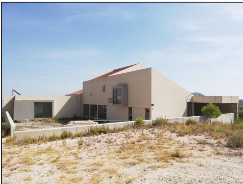
Imagen 5: Centro de visitantes Sierra de Pila