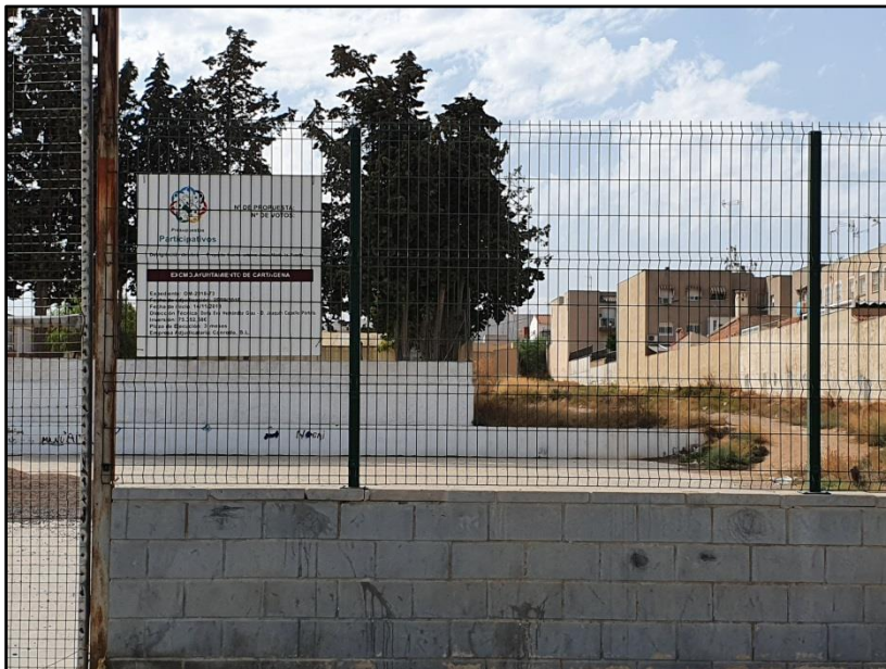
Imagen 13: Terreno para la construcción del Huerto urbano José María Lapuerta