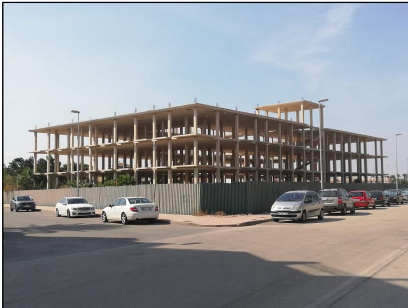
Imagen 15: Residencia tercera edad plan parcial Los Lorenzos