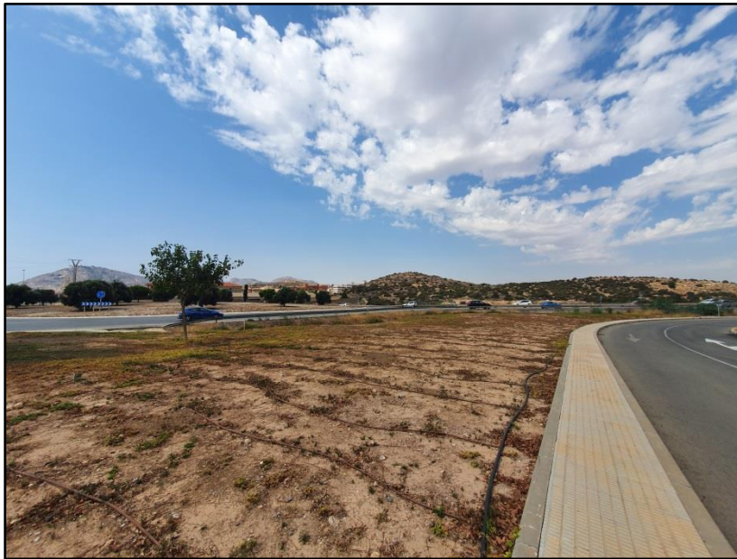
Imagen 12: Terreno para la construcción del área de servicios para autor caravanas y el aparcamiento disuasorio