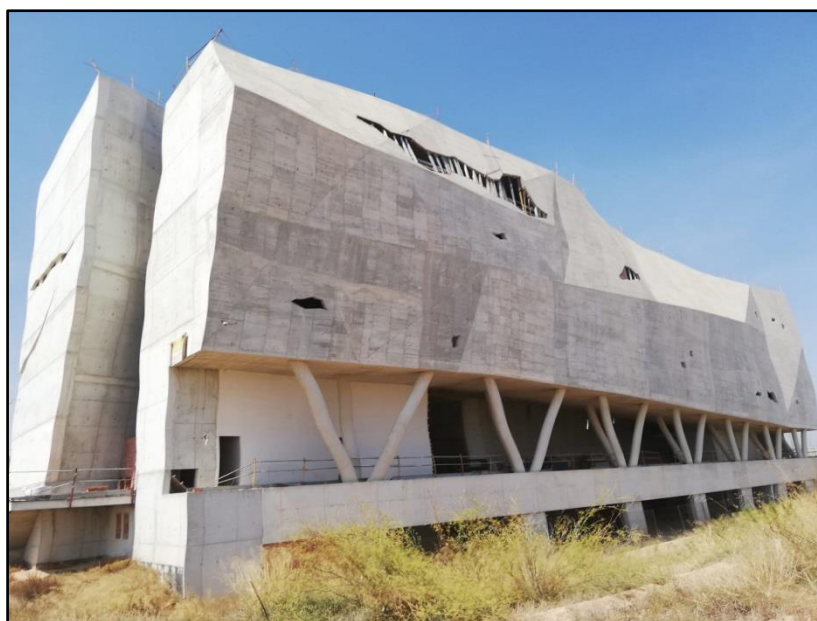
Imagen 22: Museo Regional de Paleontología y de la Evolución Humana