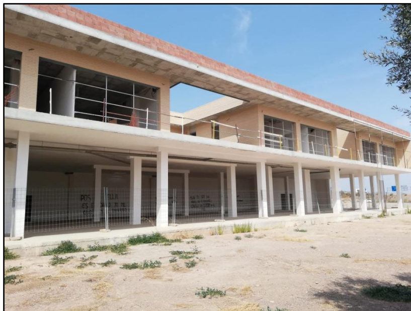
Imagen 18: Base de emergencias