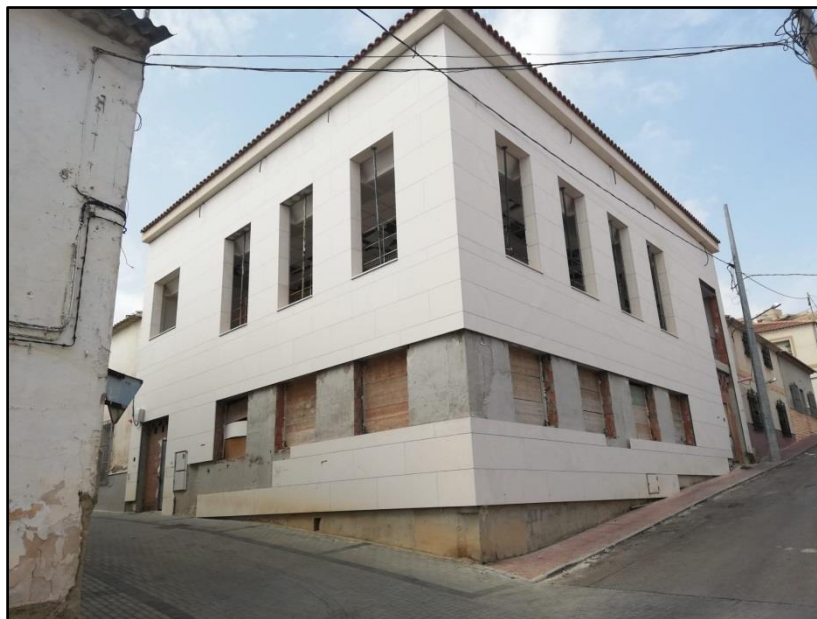
Imagen 21: Centro folklórico Virgen del Rosario