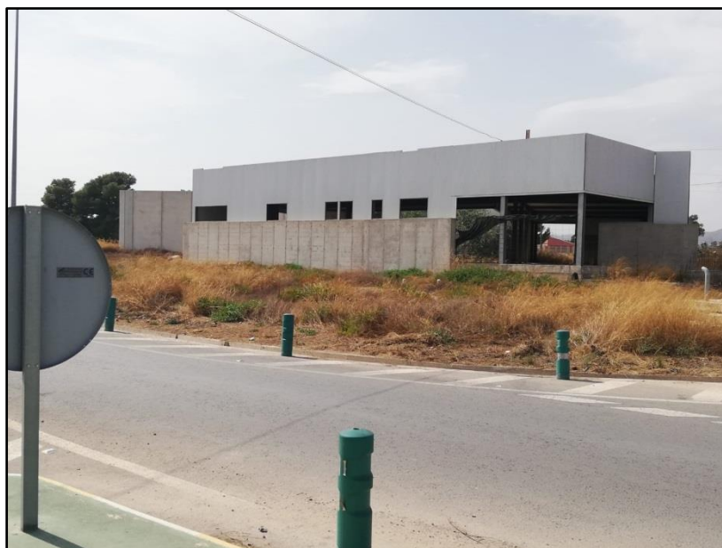
Imagen 19: Centro de atención policial