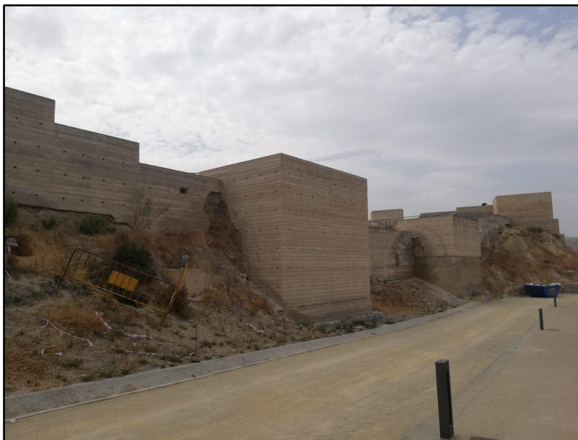
Imagen 20: Castillo de Nogalte