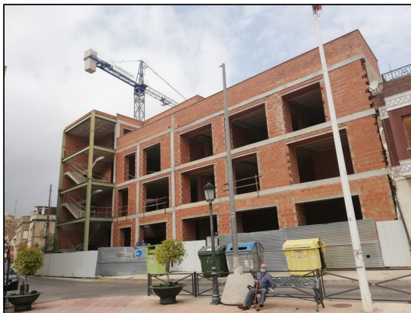
Imagen 17: Ampliación de la Casa Consistorial