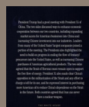
Bilateral Meeting in Beijing. The White House. May 14, 2026