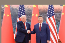
El Presidente Xi Jinping Sostiene Conversaciones con el Presidente de Estados Unidos Donald Trump. República Popular China. 2026-04-14