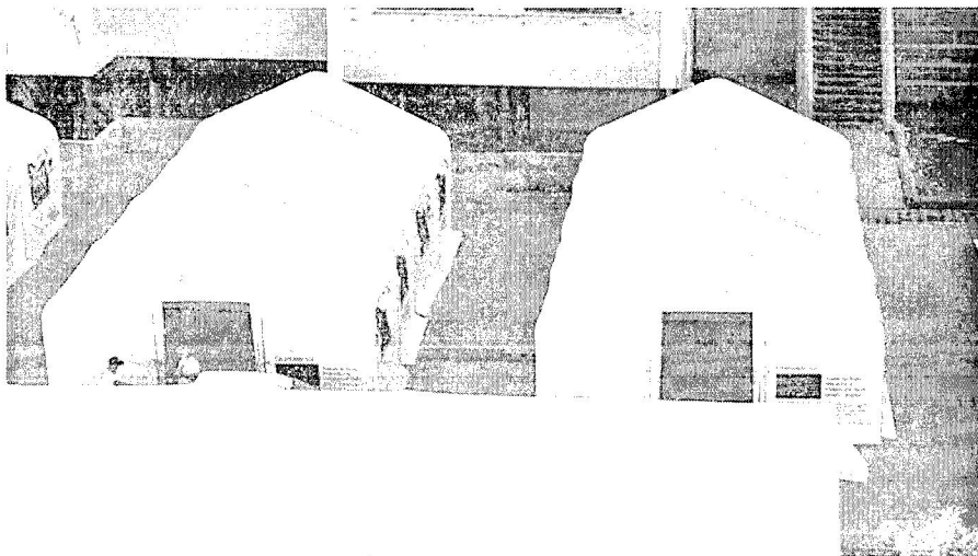
Carpas habilitadas en el Colegio León.

Grupo Parlamentario VOX, Carrera de San Jerónimo s/n 28071 Madrid