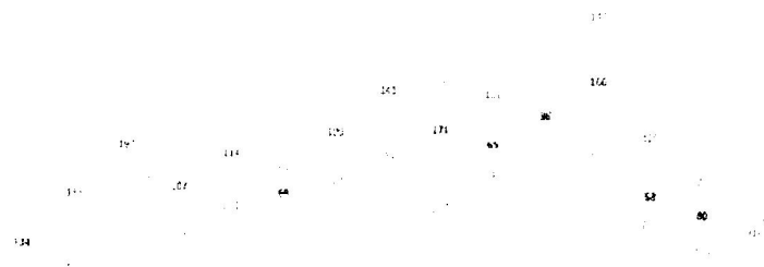
Figura 1. Número de casos secuenciados asociados a muestreo aleatorio y totales en las semanas 9 a 15 en España registrados en SiViEs.

Azul: datos asociados a muestreo aleatorio; verde: total; gris: no asociado a muestreo; verde: no consta