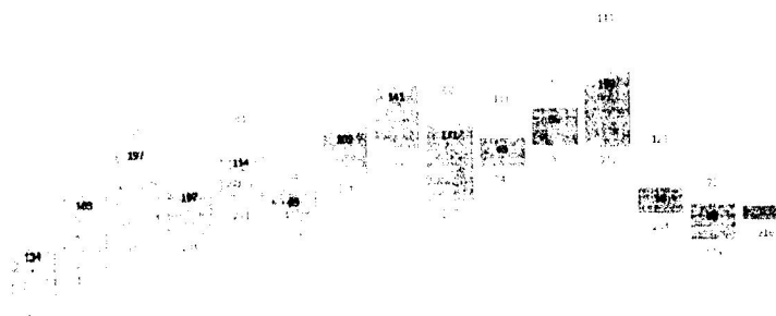
Figura 1. Número de casos secuenciados asociados a muestreo aleatorio y totales en las semanas 9 a 15 en España registrados en SiVIes.

Azul claro: asociado a muestreo aleatorio; azul oscuro: no asociado a muestreo; verde: no consta