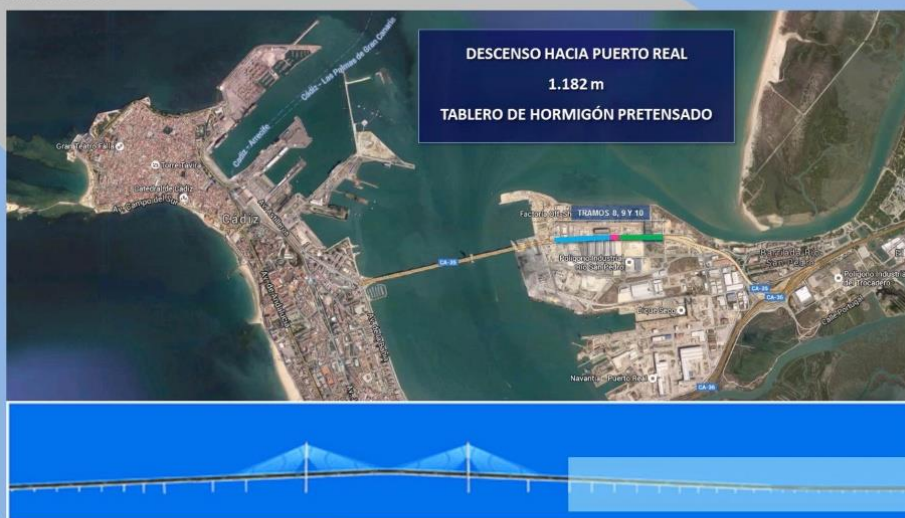
Puente de la Constitución de 1812