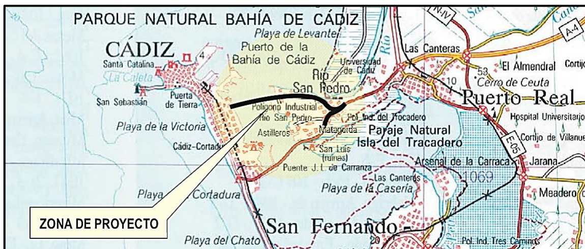
GRÁFICO Nº 2. PLANO DE UBICACIÓN DE LA OBRA