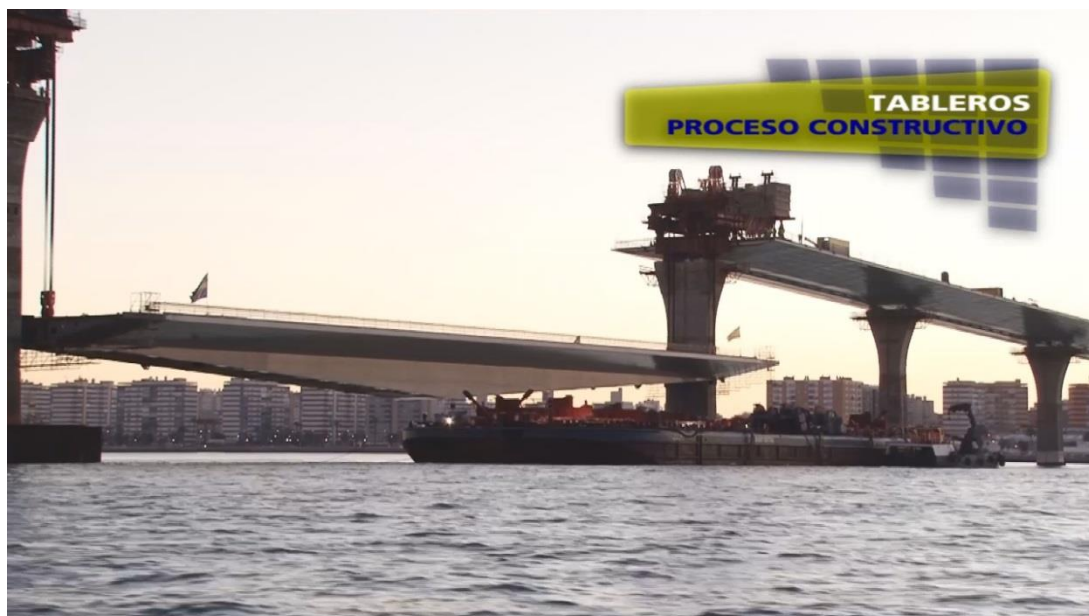
Traslado, izado y montaje del puente desmontable