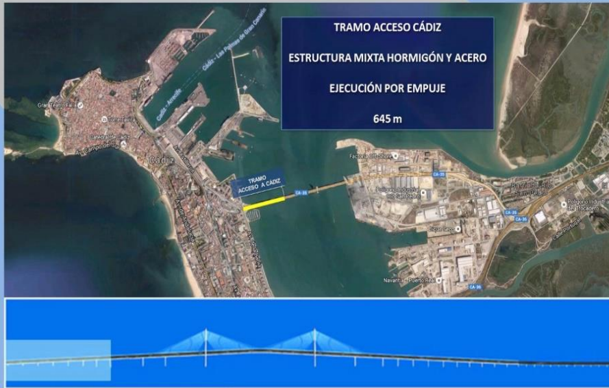
Puente de la Constituci n de 1812