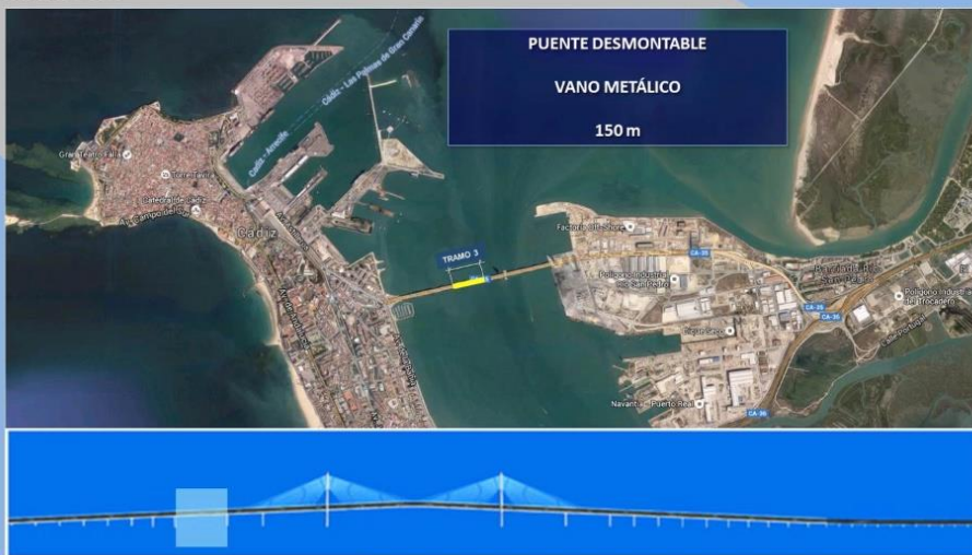
Puente de la Constituci n de 1812