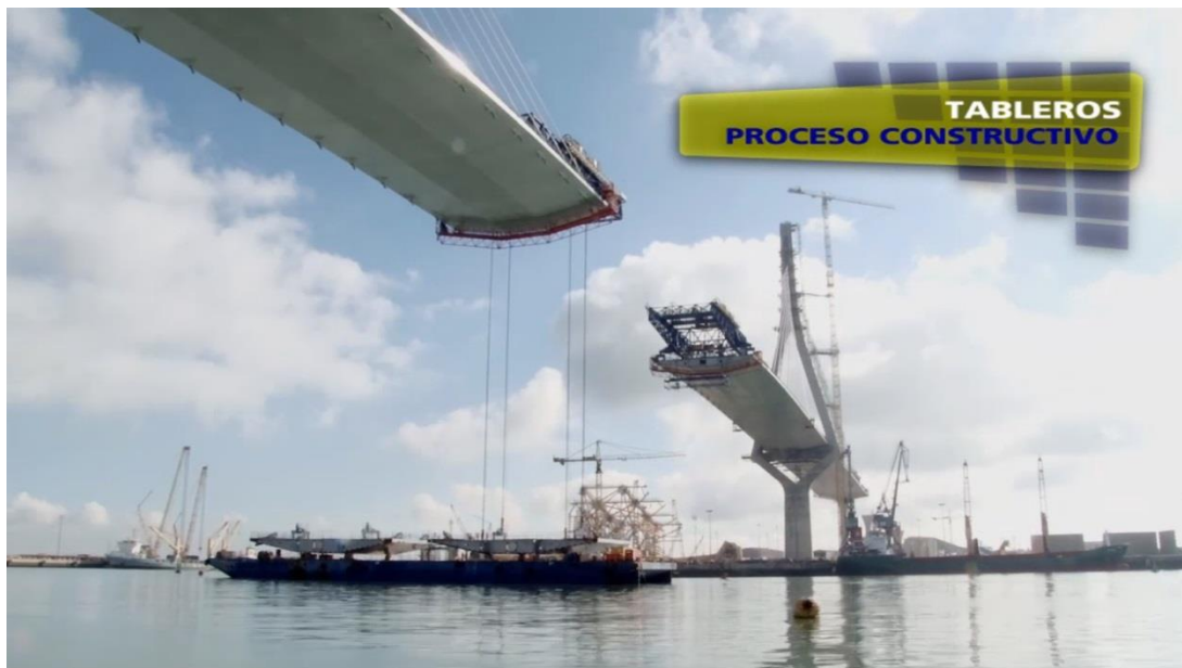
Cierre del vano central del puente