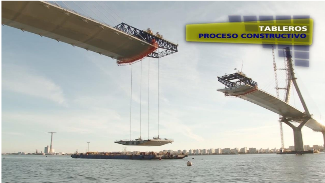
Traslado de dovelas en pontona (“load out”) e izado para montaje.