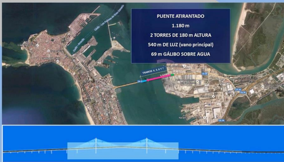
Puente de la Constitución de 1812