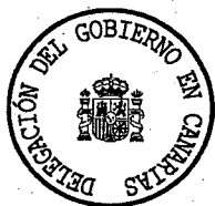
Mercedes Roldós Caballero