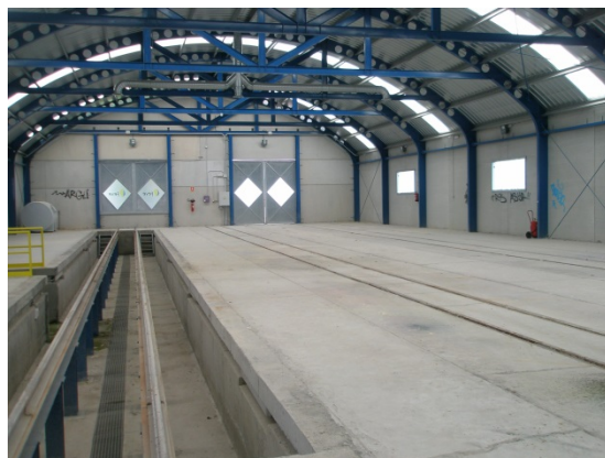
Fotografías del cocherón de la estación de San Feliz de Torio, tomadas durante la visita del equipo fiscalizador.